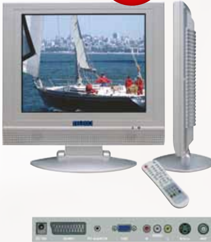
LCD TV-Gerät 17 Zoll