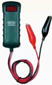
Batterietester Kabellänge 90 cm